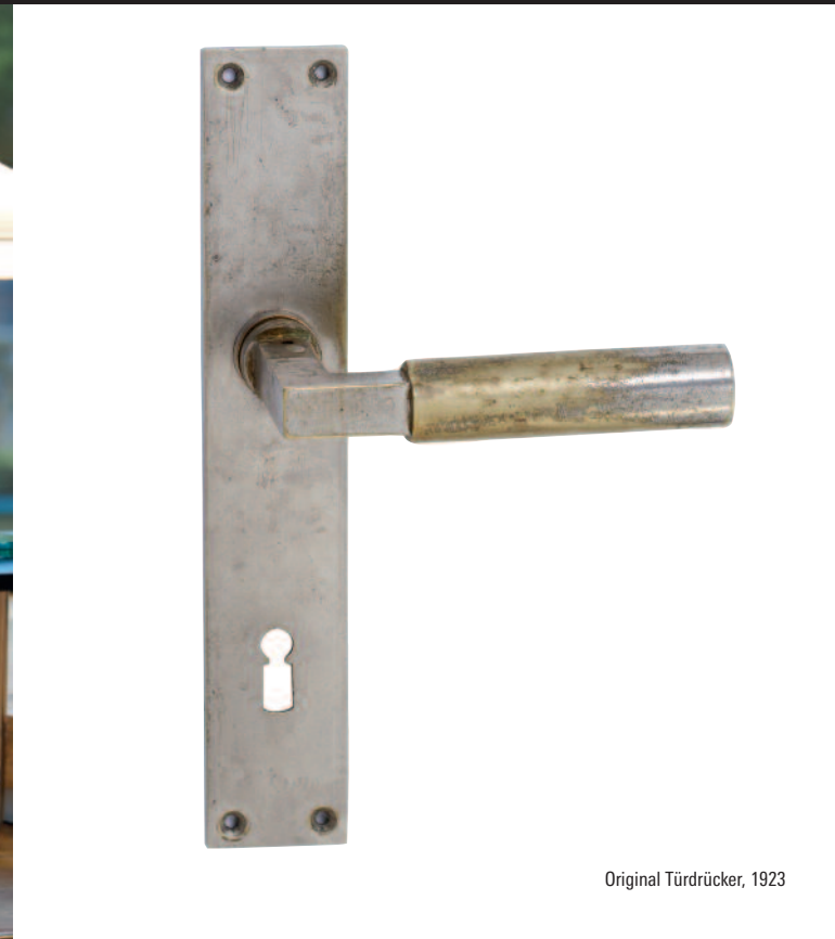
Original Türdrücker, 1923